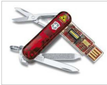
Ist der CFA für jede Karriere geeignet?

Die Geschichte des Chartered Financial Analyst (CFA) in der Schweiz stellt geradezu einen Siegeszug dar. Als die CFA Society Switzerland Anfang der 90er Jahre entstand, gab es gerade einmal wenige Dutzend Charterholder hierzulande. Bis 2013 ist diese Zahl auf fast 2500 angeschwollen. Dies spricht dafür, dass sich immer mehr Finanzprofis durch die Qualifikation Vorteile für ihre Karriere versprechen. Doch hilft ein CFA tatsächlich bei der Karriere weiter oder handelt es sich um eine nutzlose Mühe? Wir haben nachgefragt.